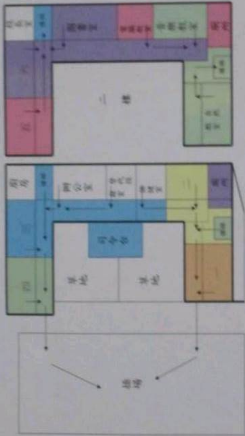
太平國小疏散避難地圖